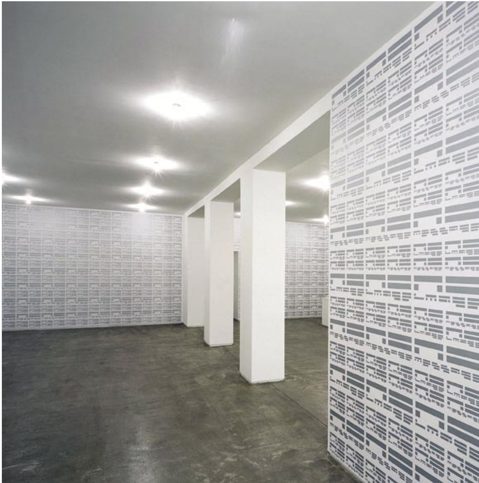
01 »No Image No Message« (wallpaper installation). Galerie Markus Richter, Berlin.